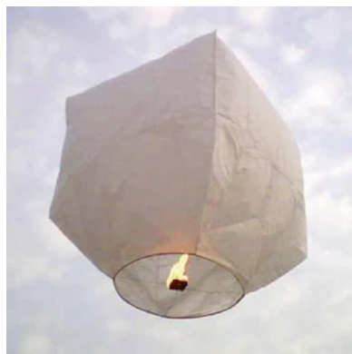
图 2 孔明灯