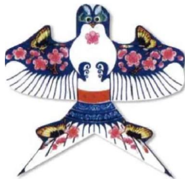
图 1 纸鸢